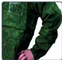
Механические и химические ловушки на рукавах и куртке