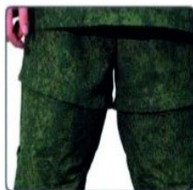
Механические и химические ловушки на брюках