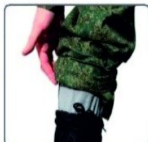
Внутренние манжеты на брюках заправляются в сапоги