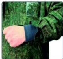
Дополнительные трикотажные манжеты на рукавах